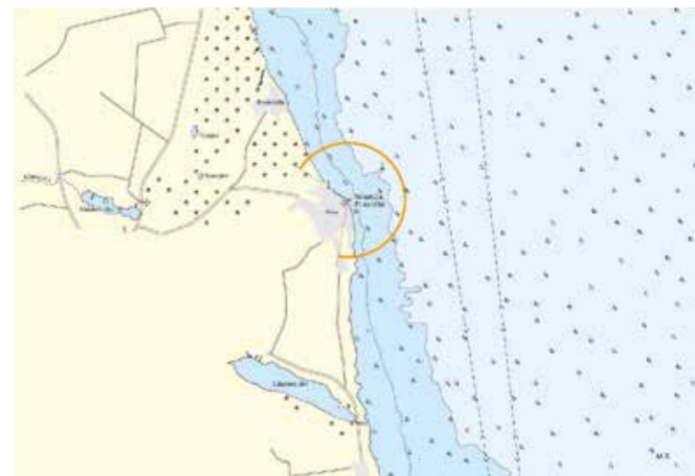
Выдержка из "Атласа внутреннего судоходства Эстонии" 2022 г.