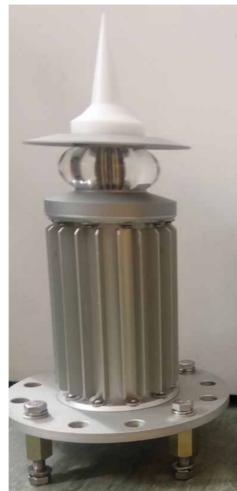
На сегодняшний день используется кольцевая лампа Sabik ekta™ E8254.W, представляющая собой устройство, оснащенное радиатором, где основной и резервный источники света расположены в одной лампе