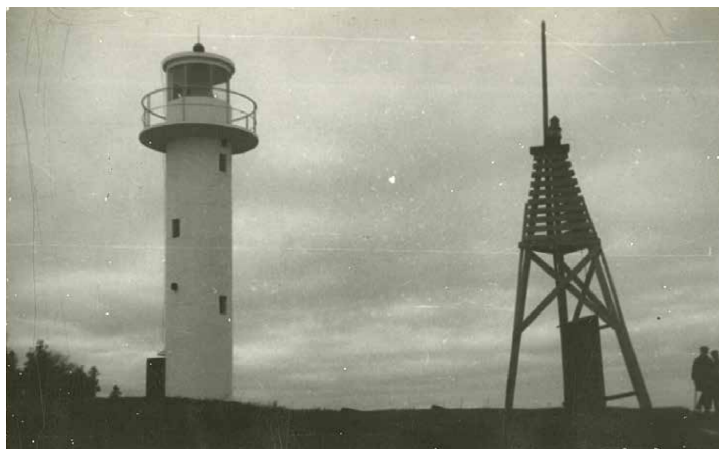
Новый маяк Нина и старый светящийся знак Нина, 1937 г.