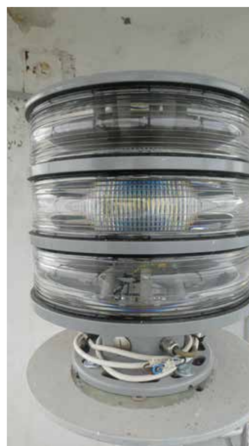
Первая светодиодная лампа (Sabik LED350-4) на маяке Нина, фото Т. Вилу